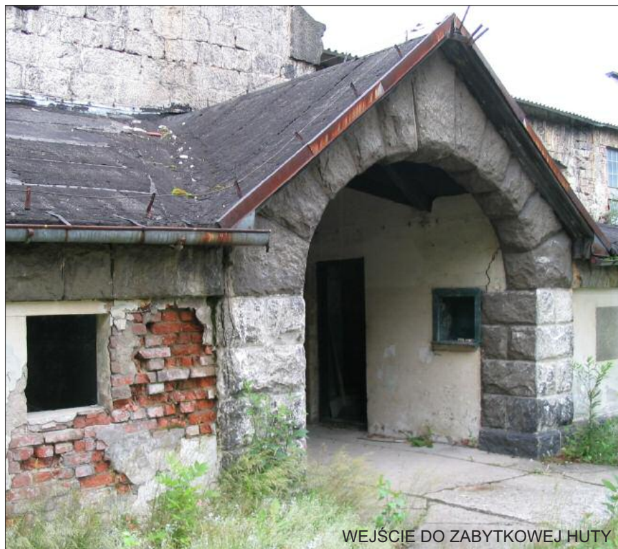
WEJŚCIE DO ZABYTKOWEJ HUTY