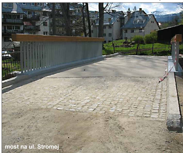
most na ul. Stromej

Przez dwa lata w Szklarskiej Porębie wybudowanych zostało 6 konstrukcji mostowych (nie wliczając wcześniejszych inwestycji). Poprzedzone to było ciężkimi i długimi rozmowami, aby miasto otrzymało na ten cel pieniądze z budżetu centralnego. Nie sztuką jest przecież budować za swoje. Dlatego w większości wykorzystujemy pieniądze z budżetu centralnego. Dziś można powiedzieć, że poza jednym przypadkiem, wszystkie mosty i kładki