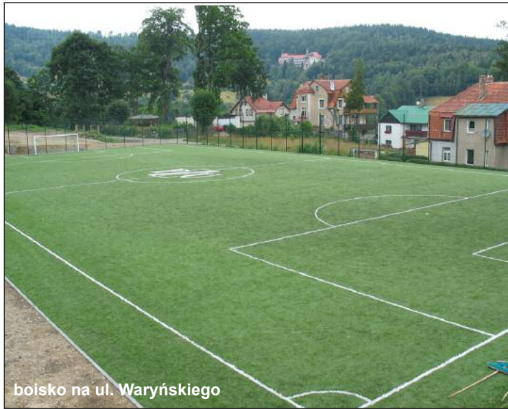
boisko na ul. Waryńskiego

dzi wśród mieszkańców różne odczucia. Ktoś może zadać pytanie: coż ten znak graficzny ma wspólnego z górą, nartami, wycieczkami itp. Na to pytanie można odpowiedzieć innym pytaniem: co wspólnego ze sportem mają trzy paski Adidasa, jaki związek z nazwą samochodu ma znak firmy Citroena? Najważniejsze cechy logotypu to: zapamiętywalność i pozytywne odczucia. I jak wskazują badania: taki właśnie jest znak marki Szklarska Poręba.